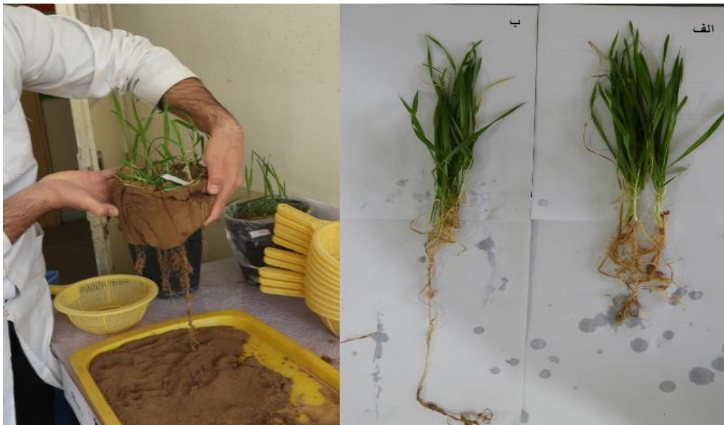
شکل (۲) مقایسه اندام هوایی و ریشه گیاه گندم الف) تیمار کود دهی شده با استروویت ب) تیمار شاهد (بدون کود فسفر) Figure(2) Comparison of shoots and root of wheat plant a) struvite b) Blank (without P fertilizer)

نتایج تجزیه واریانس داده‌های اثر نوع تیمار کودی و سطوح مختلف استروویت و اثر متقابل آنها بر غلظت نیتروژن اندام هوایی و ریشه گیاه گندم در سطح احتمال یک درصد ( P < 0/01 ) معنی‌دار شد (جدول ۵). مقایسه میانگین‌های اثر تیمارهای مورد بررسی نشان داد که با افزایش سطوح مصرف و همچنین زمانی که استروویت جایگزین کود سوپر فسفات تریپل می‌شود مقدار نیتروژن در اندام هوایی و ریشه گیاه