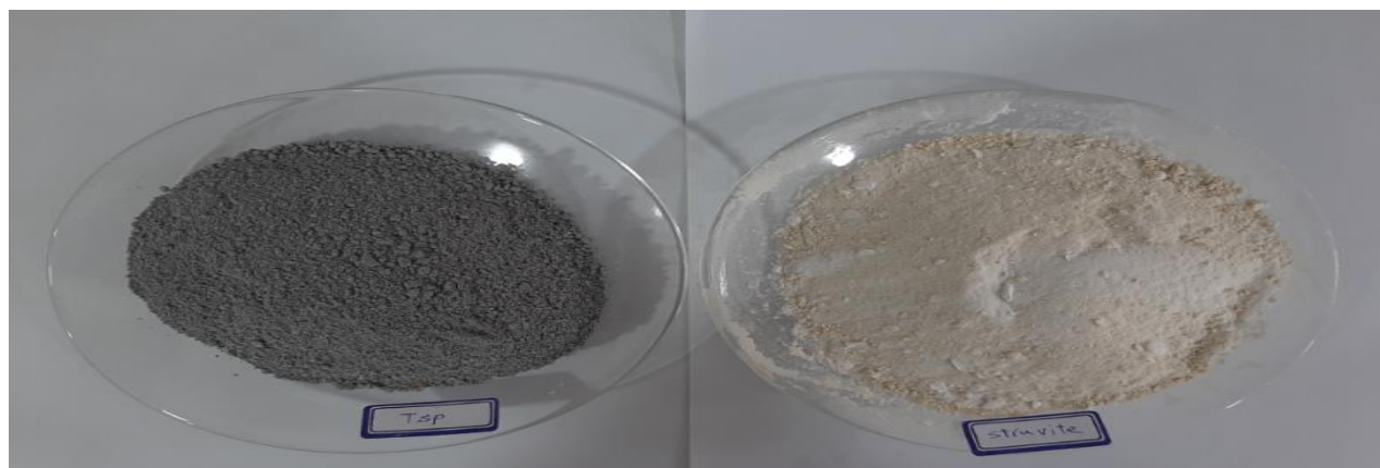
شکل (۱) استروویت بازیابی شده (فسفات آمونیوم منیزیم) و کود فسفر تجاری (سوپرفسفات تریپل) Figure (1) Recovered struvite (magnesium ammonium phosphate) and commercial phosphorus fertilizer (triple superphosphate)

ال دیوانی و همکاران ۱ (۲۰۰۷) در بررسی اثر استروویت بازیابی شده از فاضلاب صنعتی مصر در مقایسه با کودهای شیمیایی (نترات آمونیوم، سوپر فسفات تریپل و سولفات پتاسیم) در یک آزمایش گلدانی ۴۵ روزه بر روی رشد گیاه لویا در خاکی با اسیدیته ۸/۰۱ گزارش کردند که کاربرد استروویت می‌تواند عملکرد وزن تر و خشک گیاه لویا را در مقایسه با کود شیمیایی به ترتیب معادل ۵۴ و ۵۸ درصد افزایش دهد (۱۰). در همین راستا ریو و لی ۲ (۲۰۱۶) در بررسی اثر استروویت بازیابی شده از فاضلاب خوکی و استفاده از آن به‌عنوان کود نشان دادند که کاربرد استروویت وزن تر و خشک گیاه کاهو را به‌طور قابل توجهی نسبت به تیمار شاهد افزایش داد. آنها همچنین نشان دادند که کاربرد ۱۱۰ کیلوگرم در هکتار استروویت به‌عنوان کود نیتروژن باعث افزایش ۲۰۰ و ۲۷۵ درصدی وزن تر و خشک گیاه کاهو نسبت به کود شیمیایی شد. آن‌ها دلیل این افزایش را به فسفر و منیزیم موجود در استروویت نسبت دادند (۳۴). منیزیم نقش مهمی در افزایش فتوسنتز گیاهان دارد زیرا جزء کلروفیل و عامل فعال کننده