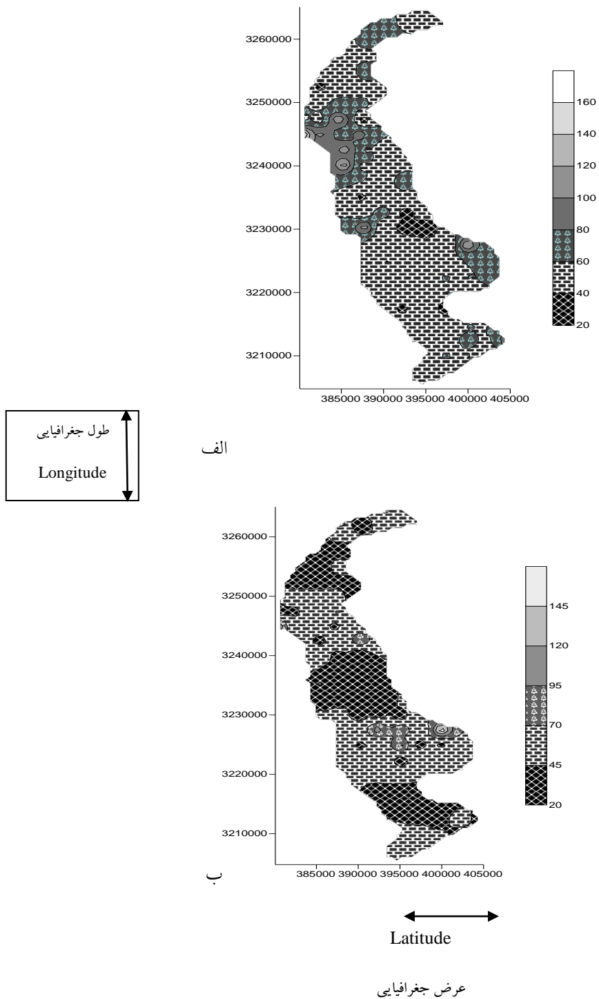
شکل (۲) الگوی پراکنش تغییرات شکل محلول فسفر (Ca 2 -P) (میلی گرم در کیلوگرم خاک) با استفاده از تخمین گر معکوس فاصله در عمق ۰-۴۰ سانتی متری (الف) و عمق ۴۰-۸۰ سانتی متری (ب)